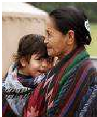
Indiáni- Latinská Amerika